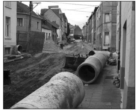
Stavba kanalizace v belgickém partnerském městě Brain L'-Alleud

Od belgických kolegů jsme obdrželi program květnové návštěvy Šlapanických v Braine. Slavnostní podpis smlouvy proběhne ve čtvrtek 5. května v 17.00, v pátek 6. května proběhne den družebních styků mezi organizacemi,