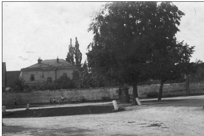
Svatojanské náměstí s lípou a sochou na původním místě, 1932