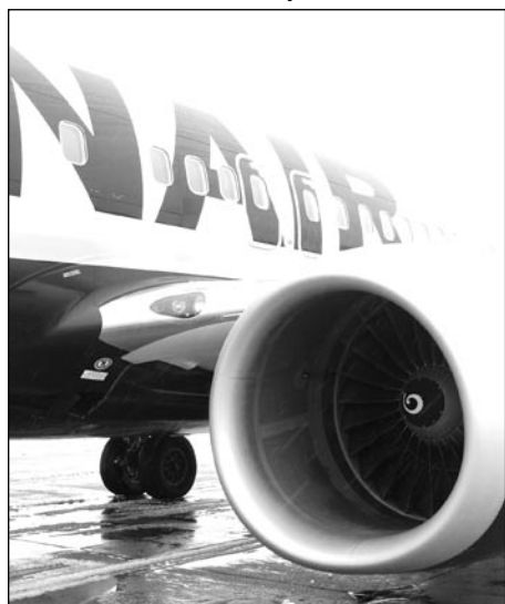
Boeing společnosti RYANAIR

Navíc letiště odebírá služby – údržbu, stavby atd. Ročně investujeme 6 až 10 miliónů do údržby a většinu z ní