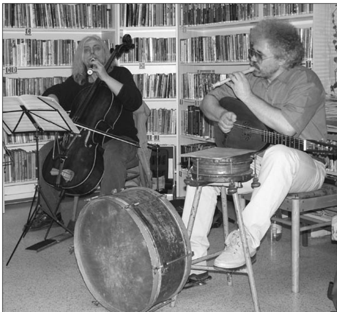
Hudební čtení v knihovně