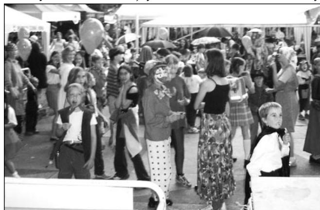
Karneval na přivítání léta 2004

Na všechny tyto akce srdečně zveme všechny občany ze Šlapanic, ale i z okolí, a hlavně ty, kteří se chtějí bavit a není jim kulturní život našeho města lhostejný. Doufáme, že nám na všechny