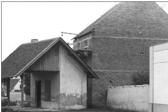
Svatojanské náměstí 1930, pohled z ulice Ponětovská