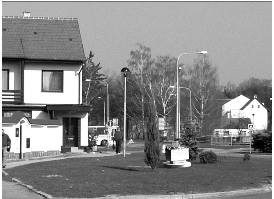
Návrh pomníku k uctění francouzských lékařů

Nedostatkem rovněž je, že na malé plochu se nevejde žádné textové sdělení, je tam pouze letopočet a korunka s písmenem N. Nedostatečný prostor v minulosti neumožnil některým vojenským klubům, aby se účastnily oficiálního programu. Proto došlo k nedorozumění a tyto kluby k nám přestaly jezdit. Řešením je pouze postavení nového pomníku mimo hřbitov, tedy ve městě. Mimochodem, u nás je celkem