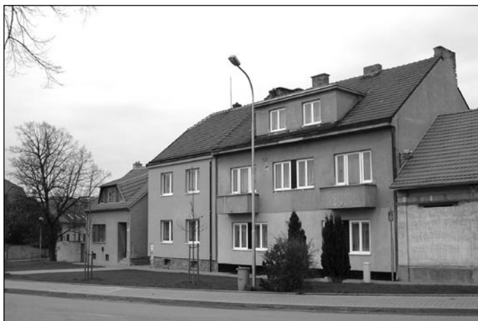
Svatojanské náměstí 2005, pohled ze stejného místa