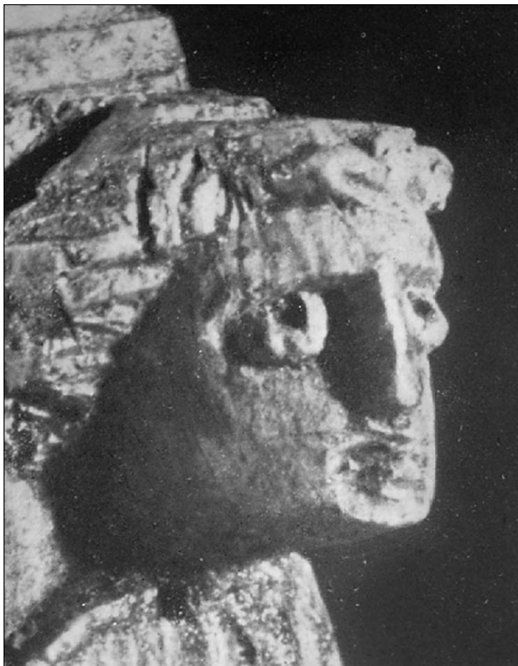
Hlavička andílka na střepeu pixidiové schránky ze slonoviny z hrobu č. II

Při druhém a zároveň posledním archeologickém výzkumu celé nekropole, byla objevena pohřební komora s kolmými stěnami, železný předmět stejného tvaru jaký byl zde objeven mez léty 1851-1853. Dále se zde našli kosterní pozůstatky pěti až šesti malých koní o kterých se zmiňuje již první archeologický výzkum. Kosterní pozůstatky muže zde však již nalezeny nebyly. Hrob byl patrně vyloupen brzy po pohřbu.