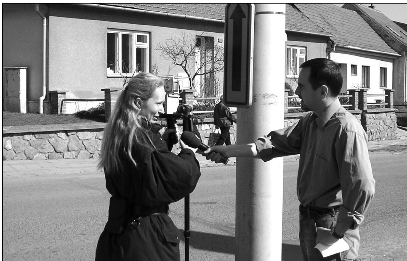
Měření rychlosti radarem za účasti České televize