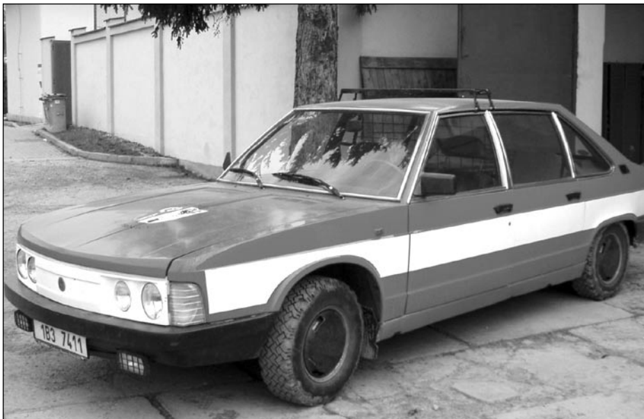
Loučení s hasičskou Tatro 623

Nyní na hasičské téma. Konečně tu máme teplé a mnohdy suché období,