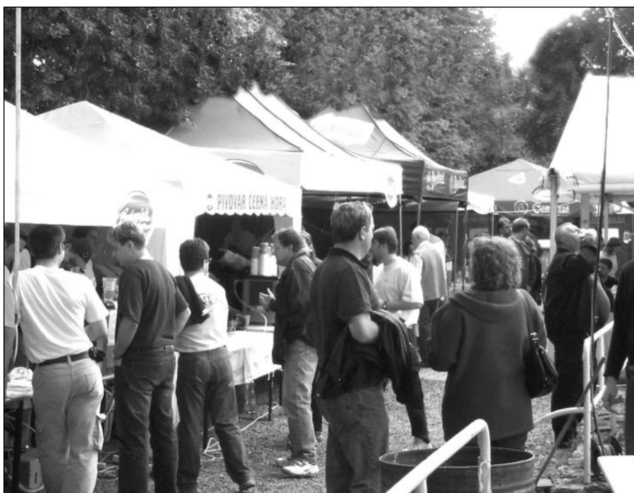
Pivní slavnosti 2004

text a foto kulturní spolek Hrbatý Hrozen