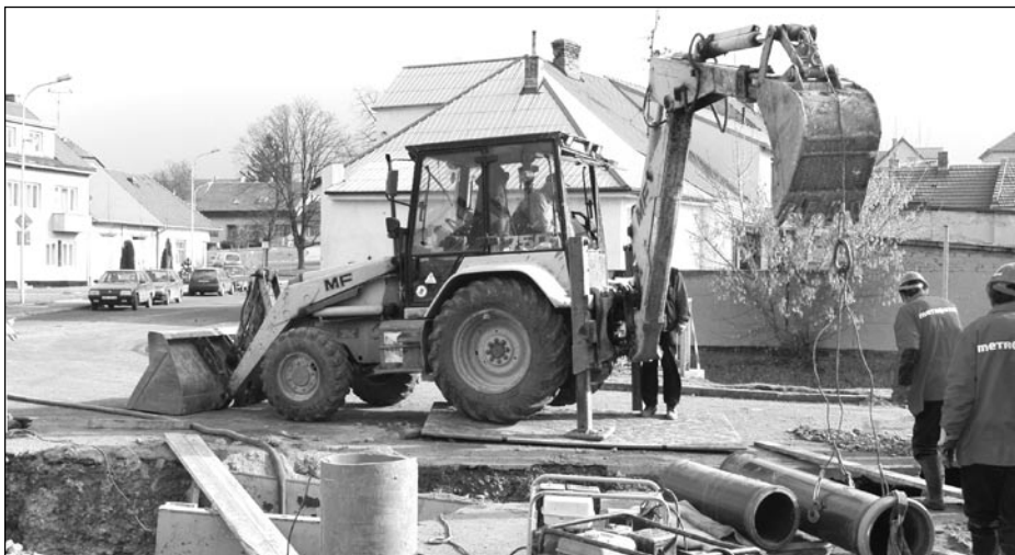
Problematické místo stavby kanalizace na křižovatce ulic Čechova a Lidická

Sestavil Ing. Rostislav Beránek odbor životního prostředí