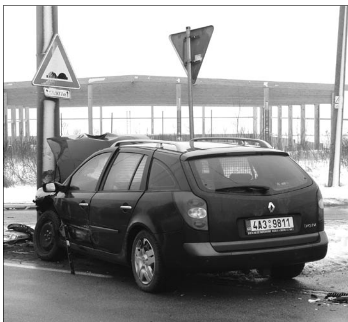
Havárie na Brněnské