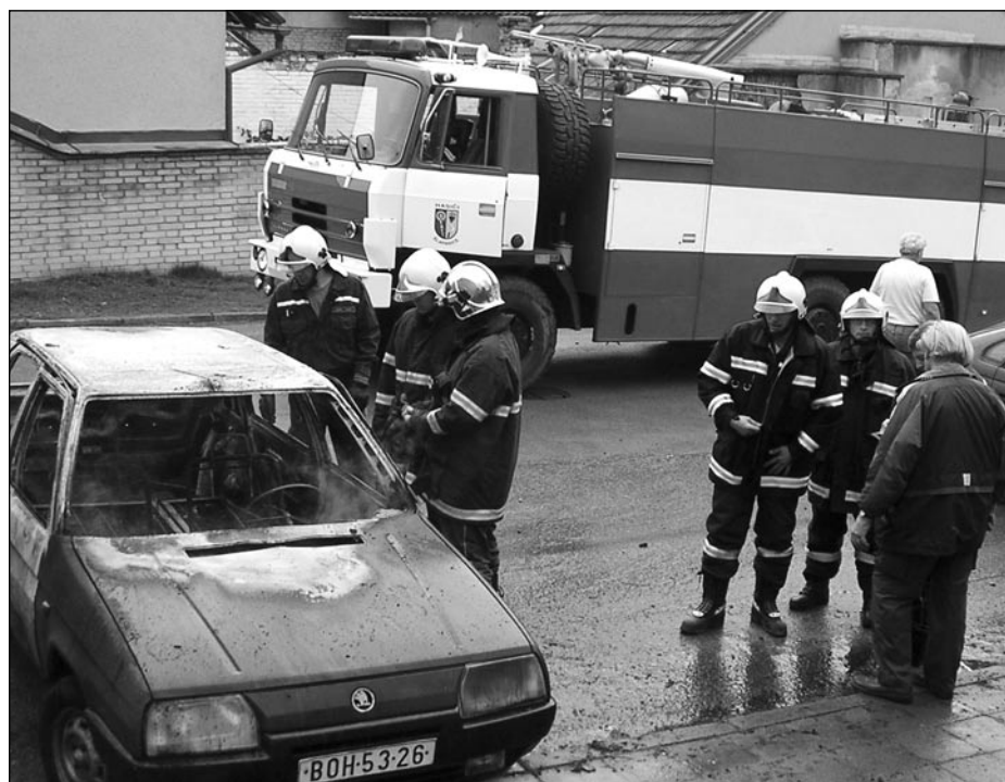
Šořelý Favorit u OD Družba

jste se již nepochybně v ulicích města setkali s vozidlem, které nahradilo zastaralou Tatra 623. Jedná se o Škodu Forman Praktik, která sloužila u HZS