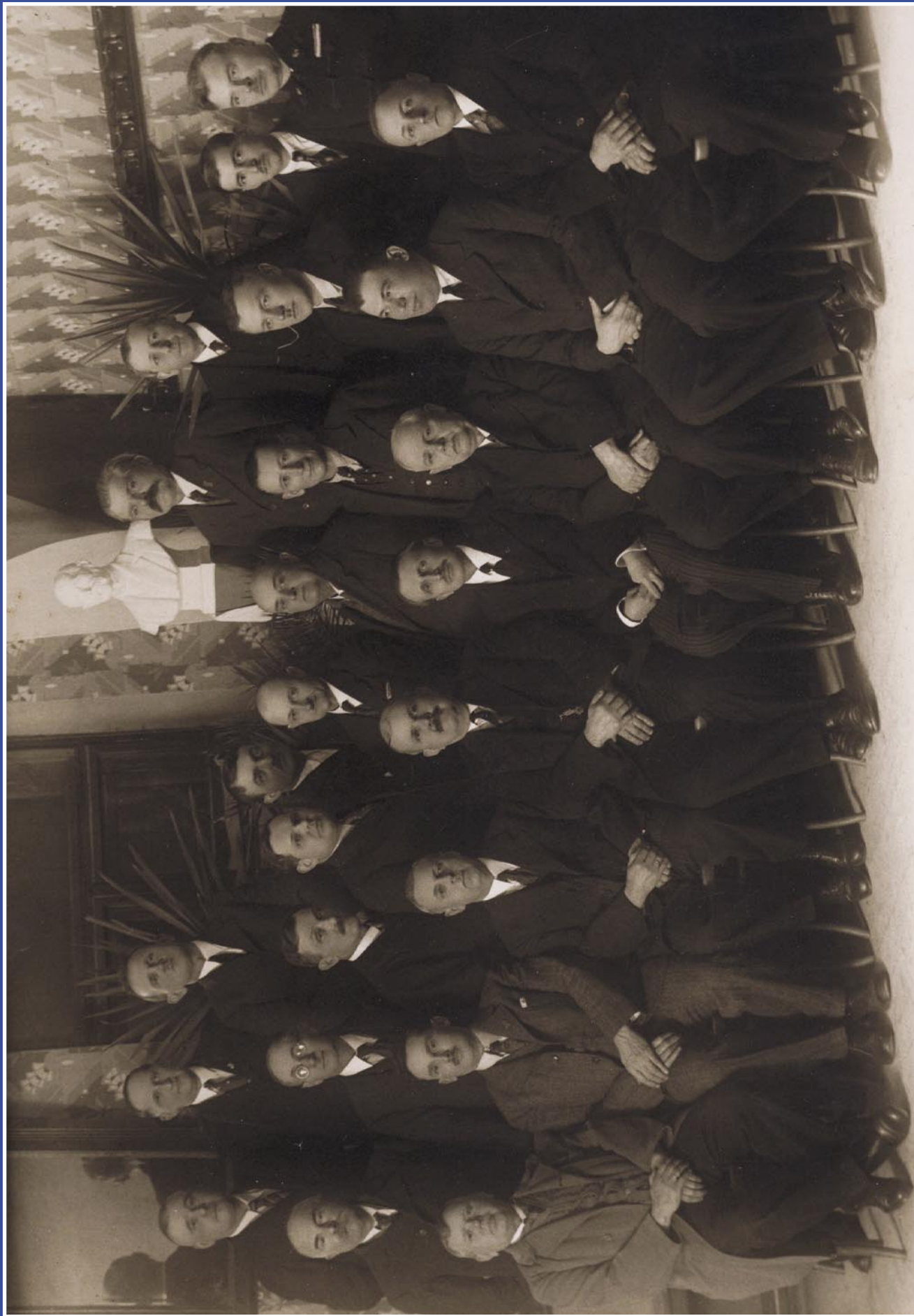
Obecní zastupitelstvo vyzvalo v r. 1935 veškeré občanstvo, aby důstojně vzpomenulo 85. narozenin prezidenta republiky T. G. Masaryka. Jak je vidět z dobové fotografie, představitelé obce se nechali vyfotografovat s bustou TGM. Některé tváře se nám podařilo identifikovat, jiné zůstávají neznámé. Pokud by někdo z vás, čtenářů, pomohl s určením osob na snímku, at se nám ozve do redakce.