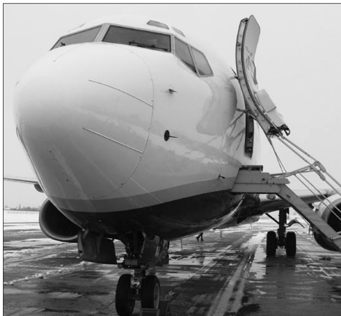
První přistání RYANAIR