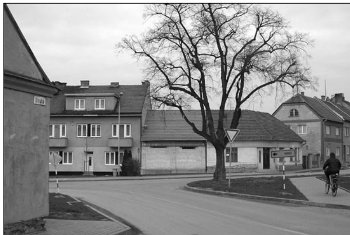
Svatojanské náměstí 2005, socha přemístěna, lípa zůstala na místě