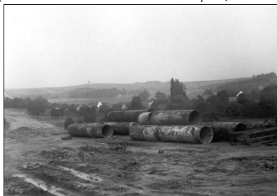
Stavba dálničního mostu u Bedřichovic v r. 1979