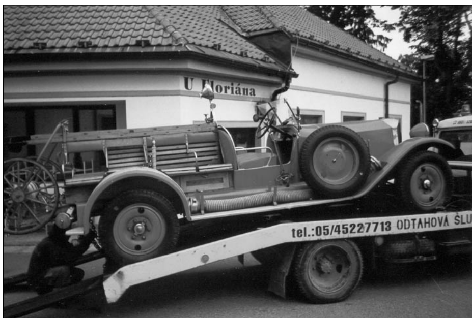
Hasičský šlapanický veterán

Před časem jsem avizoval nové překvapení v technickém vybavení jednotky. V době, kdy tento článek vyšel,