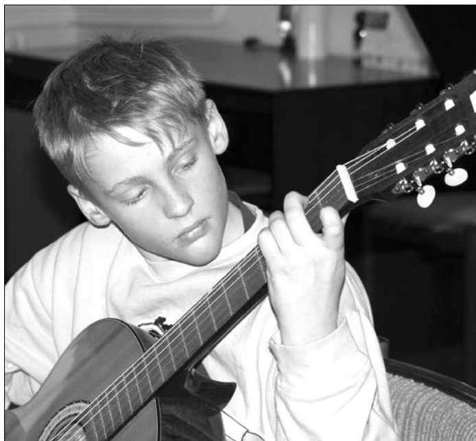
Koncert v ZUŠ