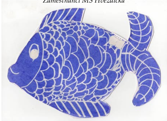
Zaměstnanci MŠ Hvězdička

Na nebi létají v podvečer andělé, pod bílou peřinou spí celá zem. Šťastné a veselé Vánoce všem!