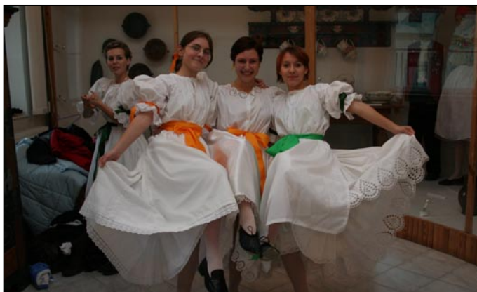
Chránový sbor kostela a národopisný soubor Vřčka ve šlapanickém muzeu