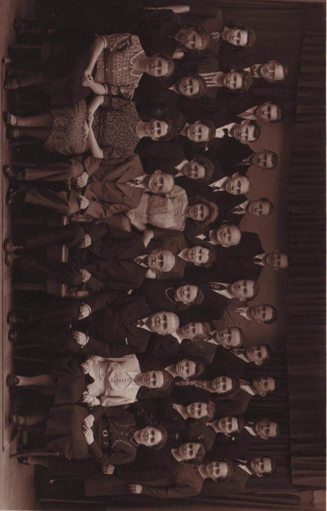
Pěvecký kostelní sbor ve Šlapanicích 1941.