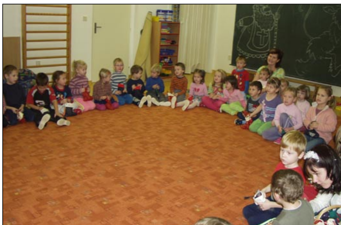
Mikulášská nadílka v Mateřské škole Hvězdička