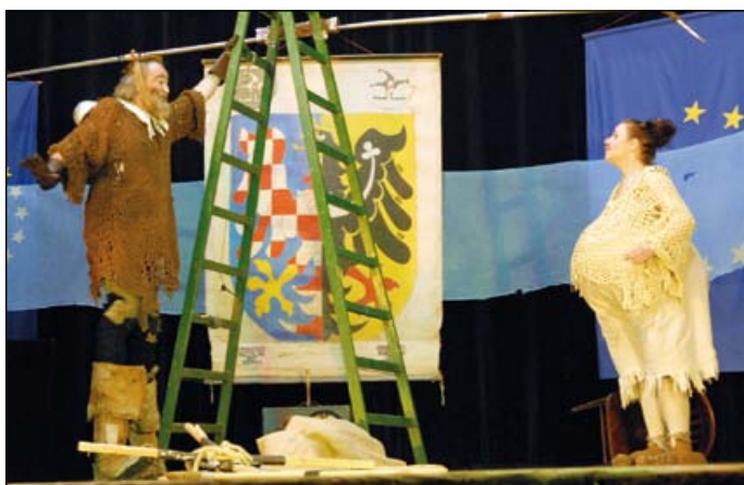
Don Quichote de la Ancha, 3. 4. 2009