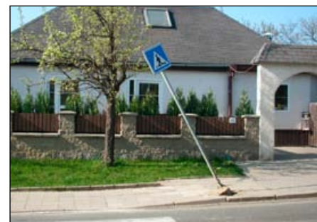
vyvrácená značka na ulici Brněnská

Za MP Šlapanice Irena Chudobová