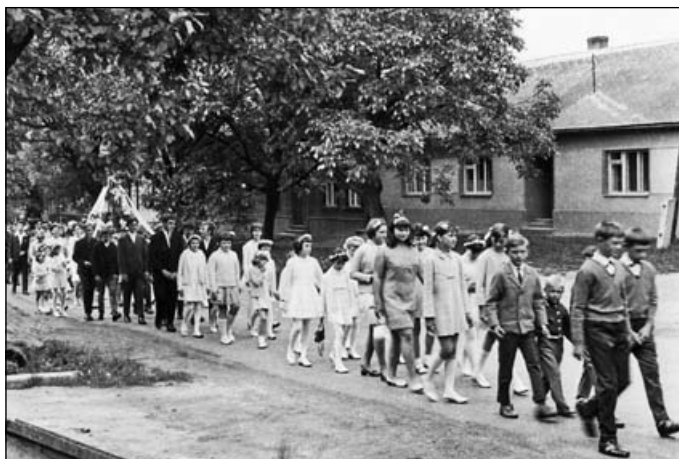
1) Průvod vychází od kobylnické zvonice. Jak vidno, řazení osob bylo důsledně organizováno; žádné promíchané hloučky,

K historii nejen zdejšího regionu neodmyslitelně patřilo pravidelné pěší putování věřících do poutních chrámů v Tuřanech, Tvarožné, ve Křtinách či na jiná nejmenovaná místa. Je to vděčné téma pro žijící pamětníky, kteří tyto poutě konávali. Zde pár vybraných snímků jedné z posledních – nemoitorizovaných – poutí roku 1969 z Kobylnic do Tuřan a zpět.