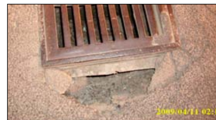
rozbitá komunikace u kanálu na ulici Brněnská