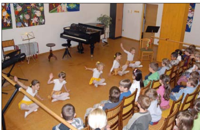
Výchovný koncert ZUŠ, 15. 5. 2009