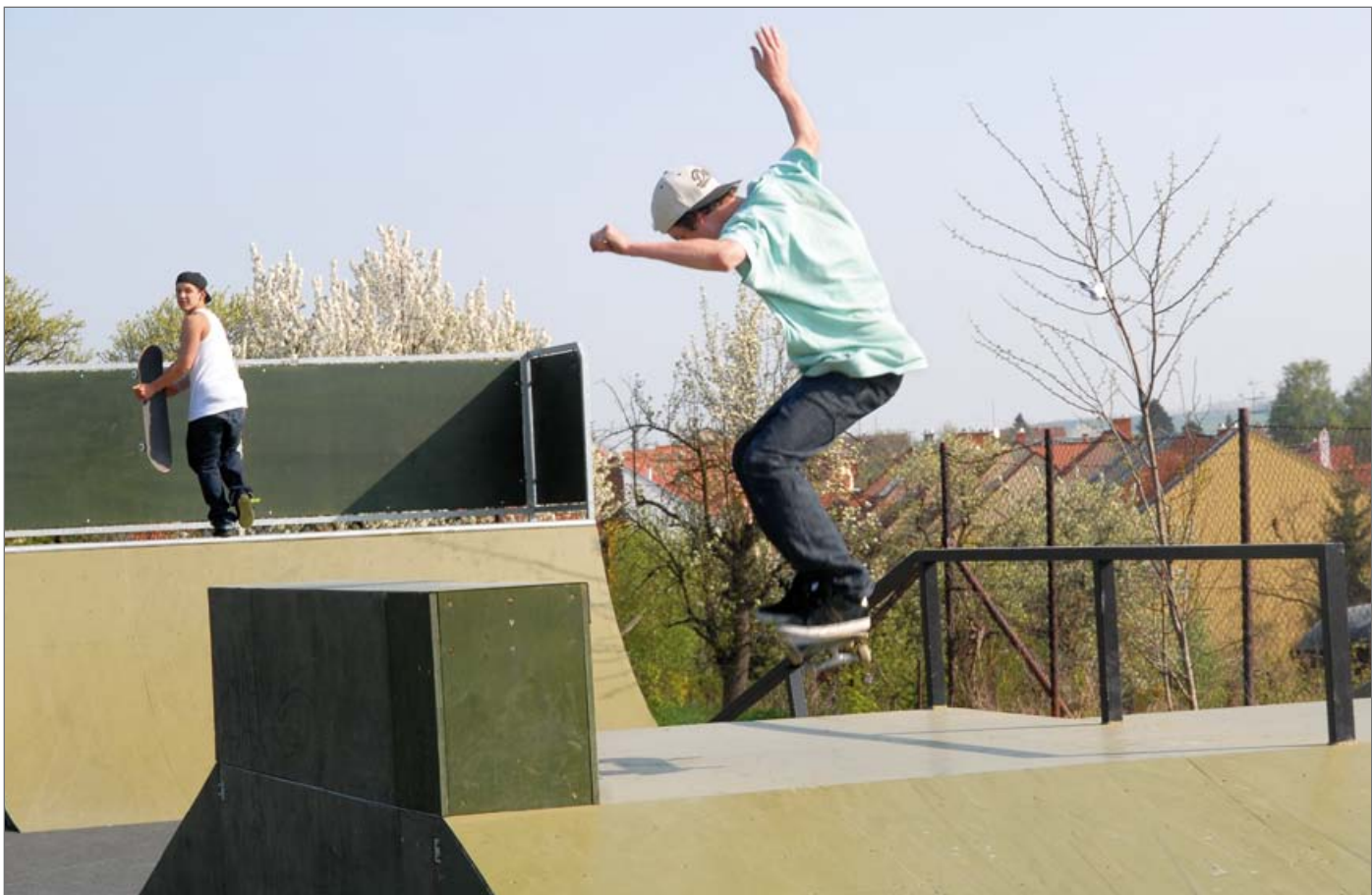
Slavnostní otevření skateparku, 16. 4. 2009