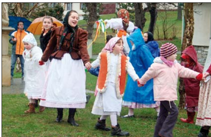
Vynášení smrtky, 29. 3. 2009