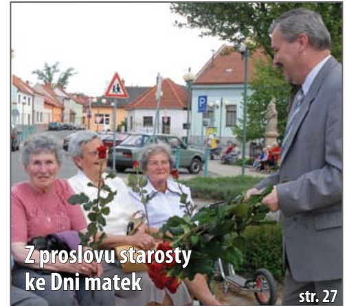
Z proslovu starosty ke Dni matek