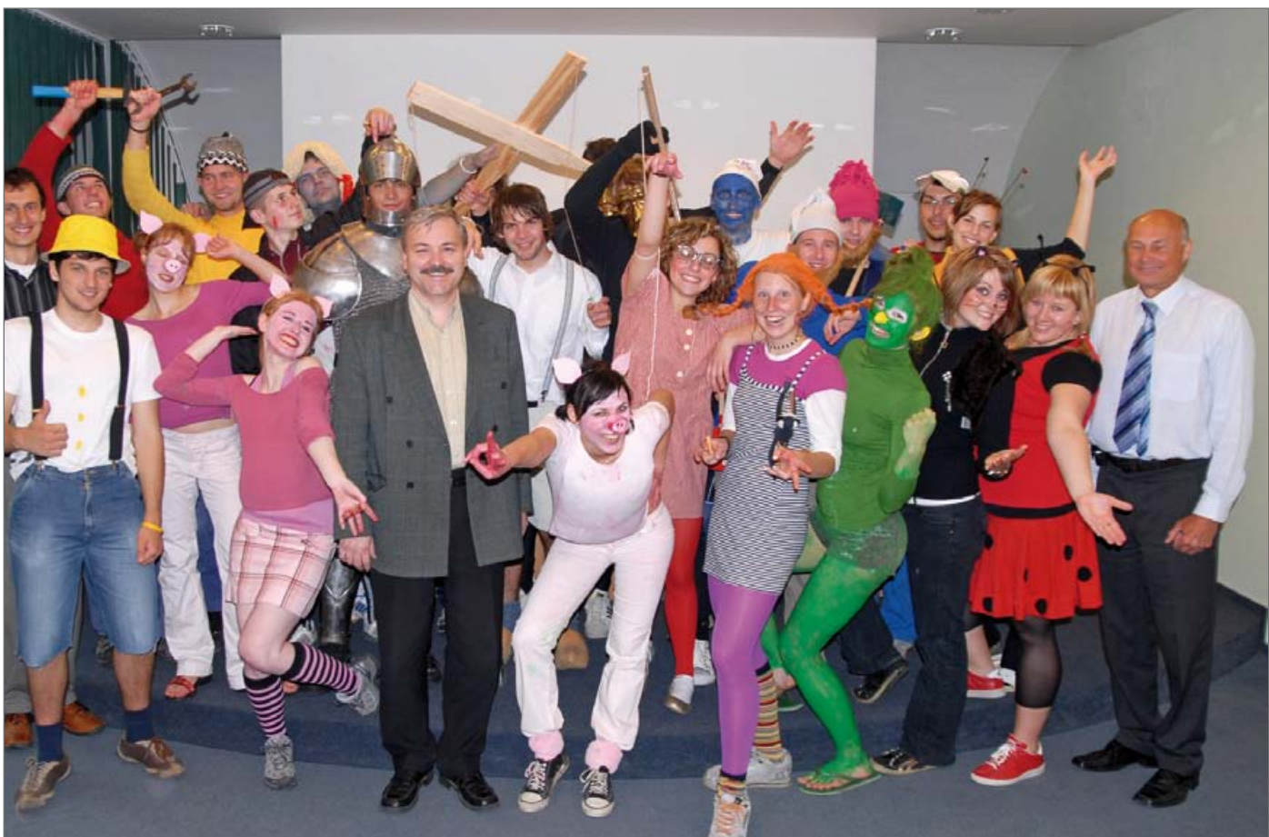
Poslední zvonění, 15. 5. 2009