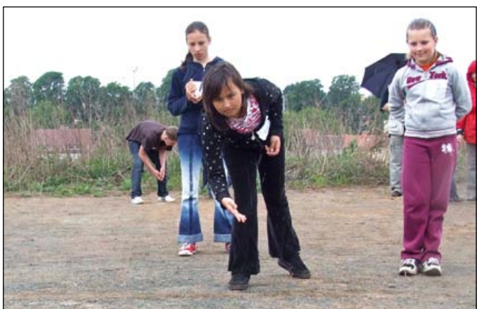
Kuličkíada, 17. 5. 2009