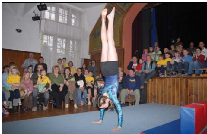
Sokolská akademie, 29. 3. 2009