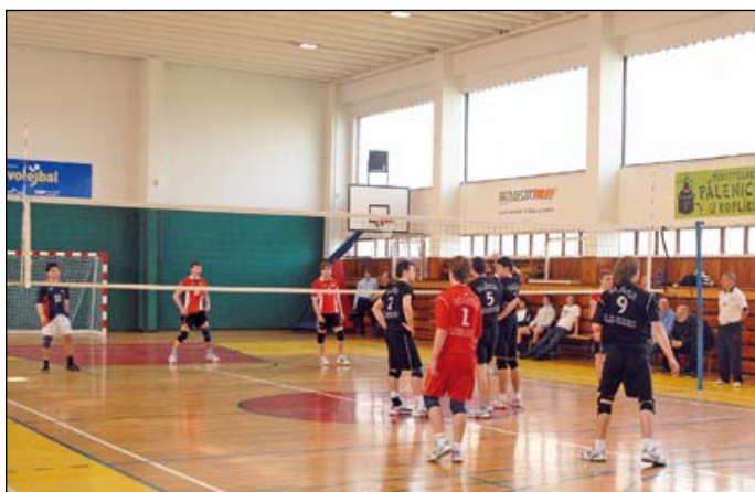
Volejbal junioři, 5. 4. 2009