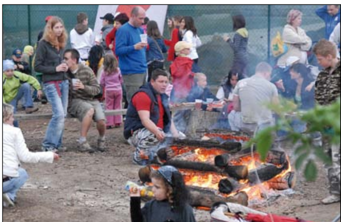
Pálení čarodějnic, 30. 4. 2009