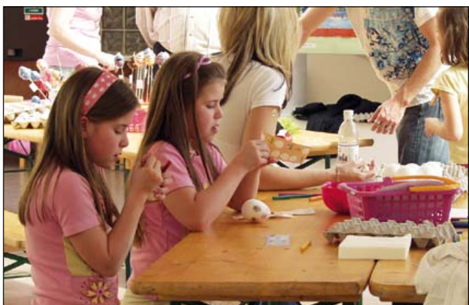
Soutěž o nejkrásnější kraslici, 4. 4. 2009