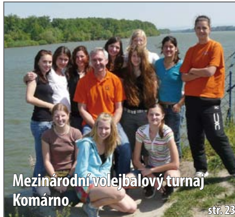
Mezinárodní volejbalový turnaj Komárno