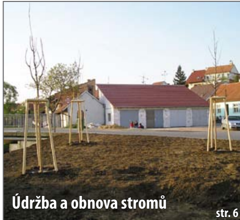
Údržba a obnova stromů