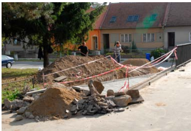
Výstavba nového bezbarierového přístupu na sídlišti

Přeji vám tedy pokud možno pokoj- nou a neuspěchanou předvánoční dobu a krásné, radostné a spokojené pro- žití vánočních svátků, kdy největším dárkem pro naše bližní jsme my sami a náš úsměv, naše pochopení, pohla- zení, naše sdílení. Nehoňme se proto zbytečně za všelijakými drahými dárky, stylem čím víc, tím líp. Nezoufejme, že nemůžeme dát to, co někteří známi, kolegové, sousedé. Naši blízcí ocení hlavně to, že jsme na ně nezapomněli, ocení i náš úsměv, radost a pokoj, a to, že na ně máme čas.