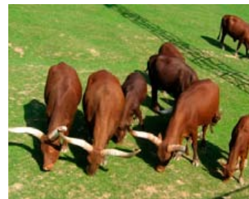
Okapi – příbuzná žirafy; sloní večeře; Antilopy koňské a pakoně; Watusi – rohy v rozpětí až 230 cm