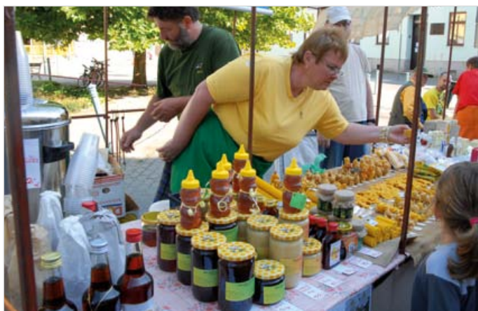
Medový den, 25. 9. 2011