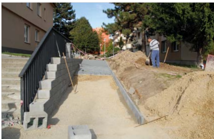
II. etapa revitalizace panelového sídliště, 29. 9. 2011