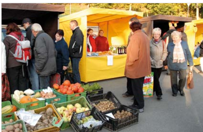
2. farmářské trhy, 22. 10. 2011