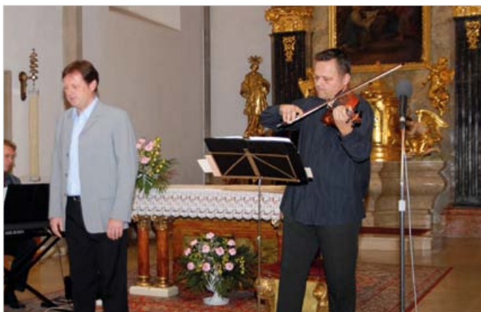
Svatováclavský koncert, 28. 9. 2011