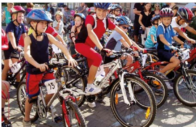
9. ročník cyklistického závodu, 2. 10. 2011