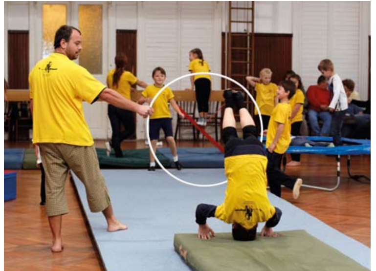
Oslava 90 let sokolovny ve Šlapanicích, 12. 11. 2011