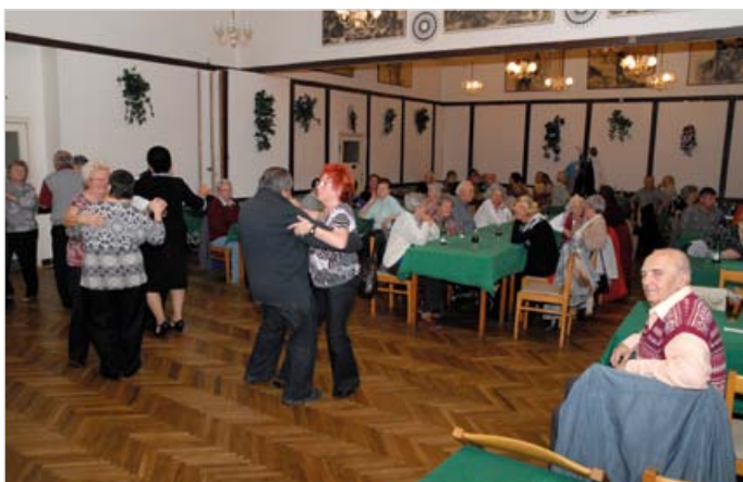
Melodie stále zelené, 20. 10. 2011