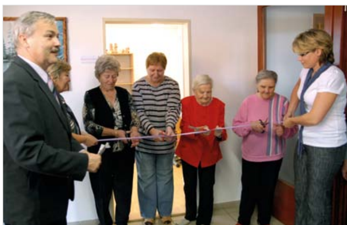
Otevření rehabilitačního centra v DPS, 8. 11. 2011