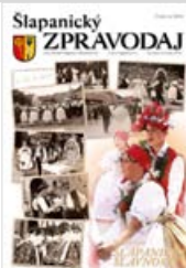
Foto na obálce: 80. šlapanické slavnosti, foto a grafika Jan Šlancar, archív Josefa Kopeckého.

ŠLAPANICKÝ ZPRAVODAJ – vychází 6x ročně, vydává Město Šlapanice, IČO: 00282651. Ev. č. MK ČR E10246. Zpravodaj připravuje redakční rada. Šéfredaktorka Jitka Nevrková, e-mail: nevrklova@slapanice.cz, tel.: 533 304 328, mobil: 724 783 070. Sazba Jan Šlancar, fotoateliér a grafické studio, www.slancar.cz. Korektura Taťana Pernesová. Tisk OLPRINT Jaroslav Olejko, Brněnská 29, Šlapanice. Náklad 3200 ks. Zdarma pro občany Šlapanic a Bedřichovic. Distribuce 3. srpna 2012. Uzávěrka příštího čísla 10. září 2012.