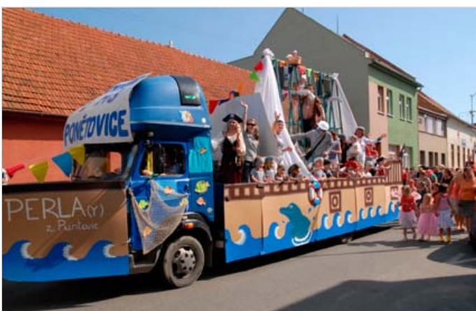
Karneval, 23. 6. 2012