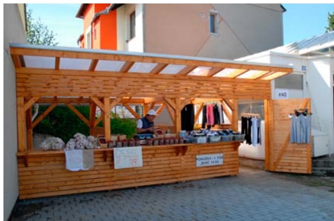
Nové prodejní místo na ulici Čechově