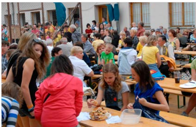
Farní den, 3. 6. 2012