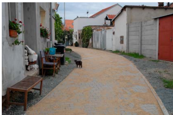
Zrekonstruovaná ulice Přiční