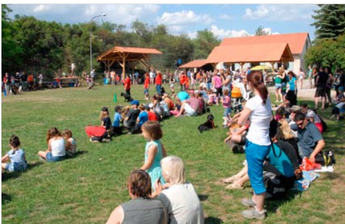
Dětský den v Hliníku, 27. 5. 2012