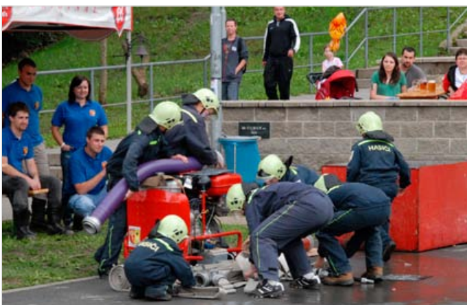
Hasiččina nejen dřina, 9. 6. 2012