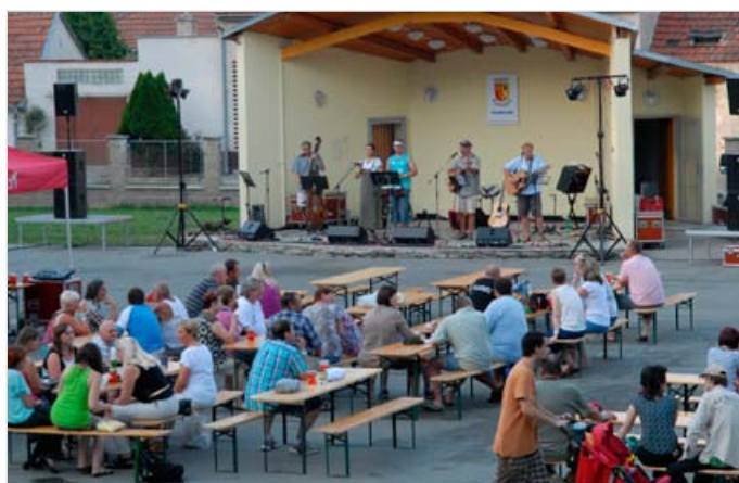
Country večer, 30. 6. 2012