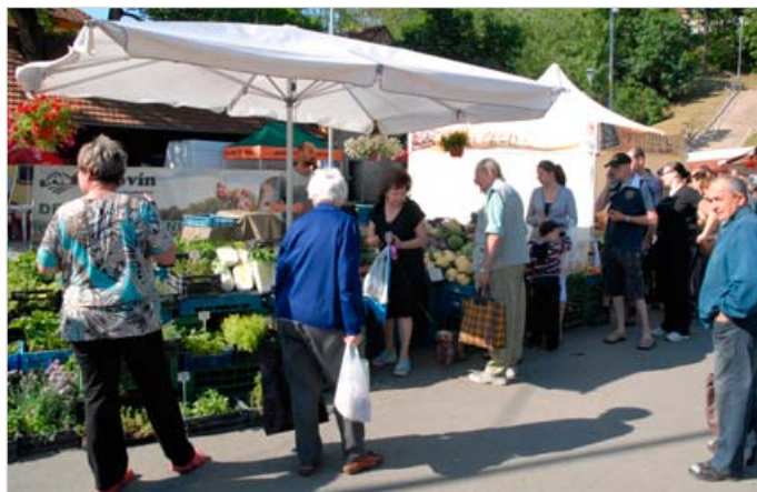
Farmářské trhy, 26. 5. 2012