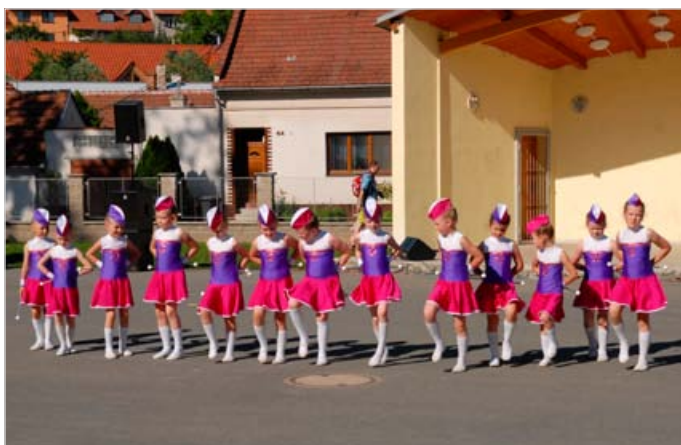
Mažoretky, 16. 6. 2012