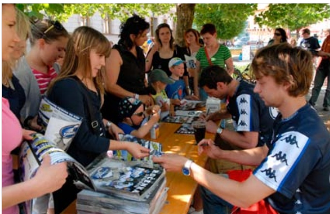
Den rodin, 20. 5. 2012