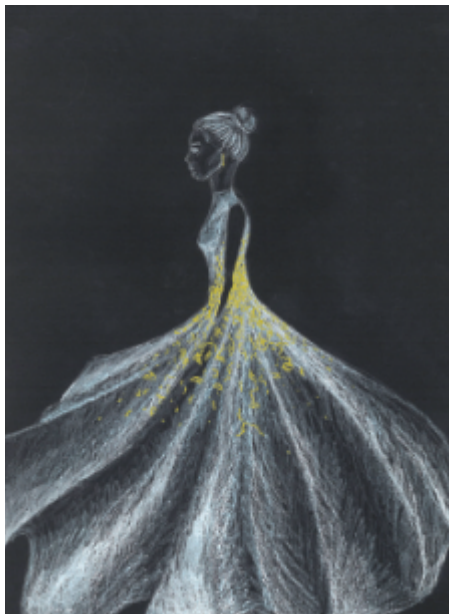
Mladí šlapaničtí umělci a téma „svatby a veselky“.

svateb vytvořené různorodými technikami. Výstavou zároveň zahájíme spolupráci Gymnázia a ZUŠ Šlapanice s Výtvarnou a taneční školou Slnečnice Art z Bratislavy, a tak v muzeu narazíte rovněž na ukázkou prací mladých autorů ze Slovenska.