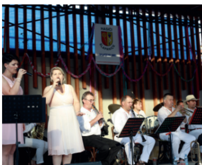
Folklorní odpoledne s Dambořankou v neděli 15. srpna 2021.