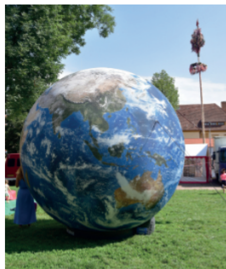
Zábavné odpoledne pro děti v sobotu 14. srpna 2021.