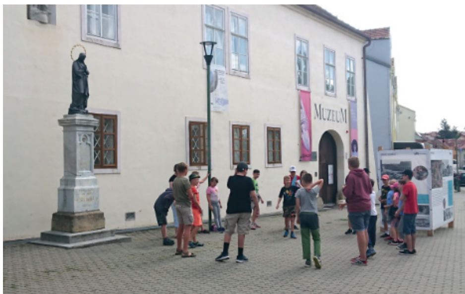
Příměstské tábory se v muzeu konají už od roku 2015.