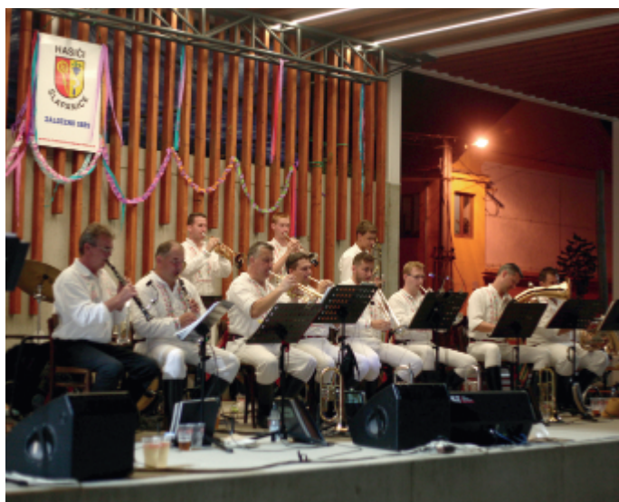
Hodová zábava s Dambořankou v sobotu 14. srpna 2021