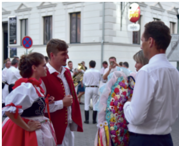
Předání práva prvnímu stárkovi v sobotu 14. srpna 2021.