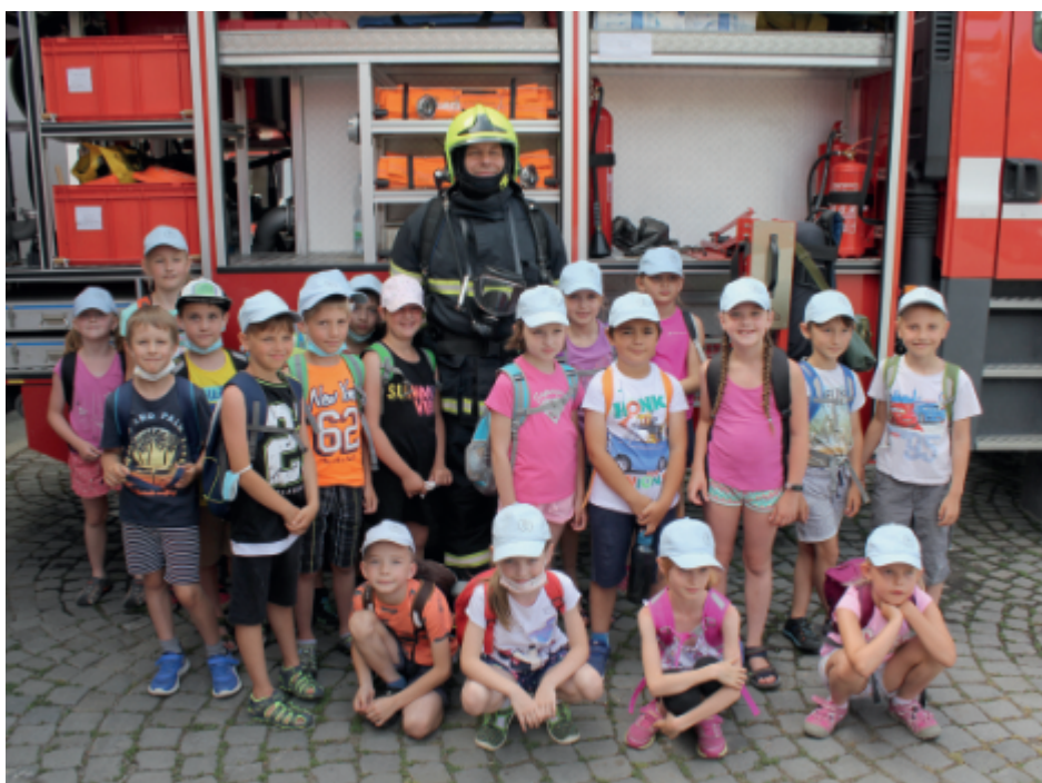
Exkurze ZŠ Šlapanice ve zbrojnici, 21. 6. 2021.