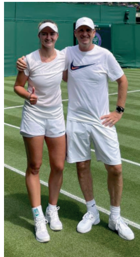
Travnatý kurt v All-England Club – Wimbledon 2021.

Věděl jsem sice, že se s Bárou dostaneme do nejlepší stovky, i do nejlepší dvacítky světových hráček, ale tomu, že bude Bára od 20. září 2021 5. nejlepší hráčkou světa, tomu bych asi neuvěřil.