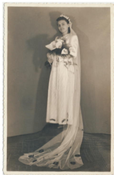
Na výstavě budete moci obdivovat i šaty této krásné nevěsty z roku 1940.

V komorních výstavních prostorech v přízemí okouzlí návštěvníky ukázka tvorby mladých umělců. Výstava Svatby a veselky je dalším výstupem dlouhodobé spolupráce muzea s Gymnáziem a ZUŠ Šlapanice. Představí originální práce s tematikou