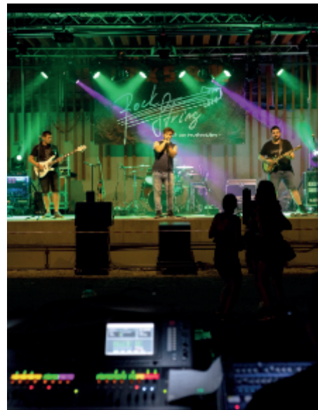
Koncert a taneční zábava kapely Rock String v pátek 13. srpna 2021.