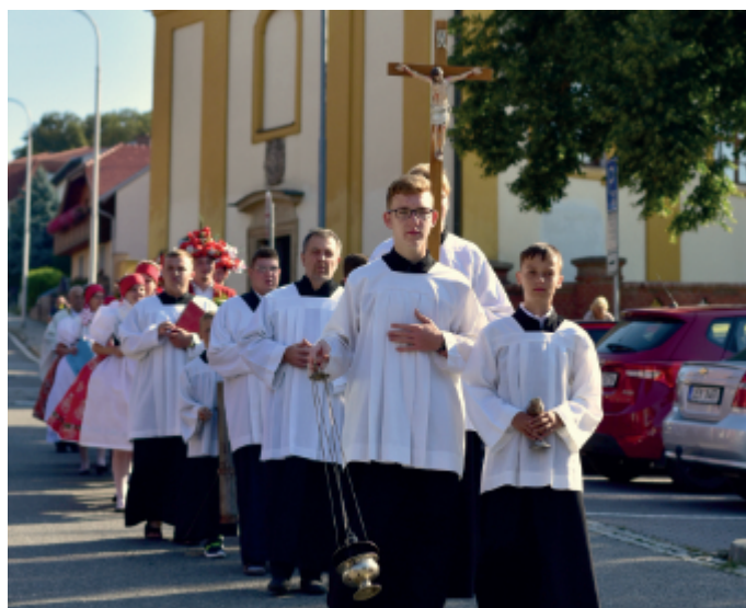
Mše svatá v neděli 15. srpna 2021.