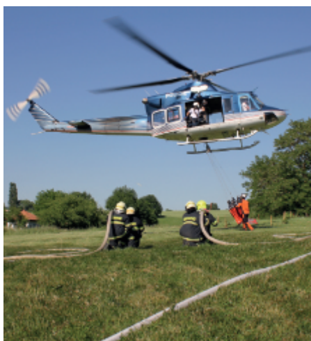
Výcvik s helikoptérou a bambi vakem ve Tvarožné, 18. 6. 2021.

V průběhu jara se porouchal náš mikrobus. Byli jsme nuceni shánět nový motor. Podařilo se a vozidlo opět, díky nasazení našich členů, zhruba po měsíci odstavení opět slouží.