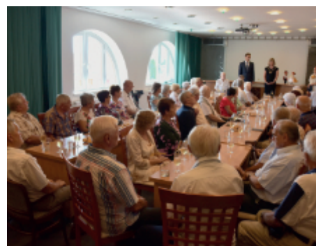
Setkání s jubilanty v sobotu 14. srpna 2021.