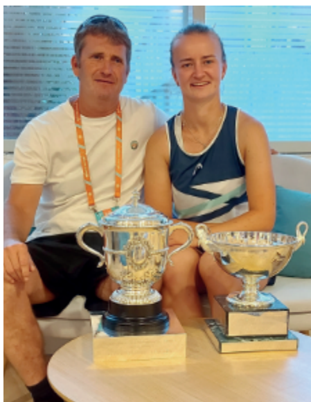
Dva poháry za dvojhru i za čtyřhru – Roland Garros 2021.

Chtěl, bohužel mi to nedovolilo zdraví. Profesionální kariéru jsem byl ze zdravotních důvodů nucen již ve 24 letech ukončit.