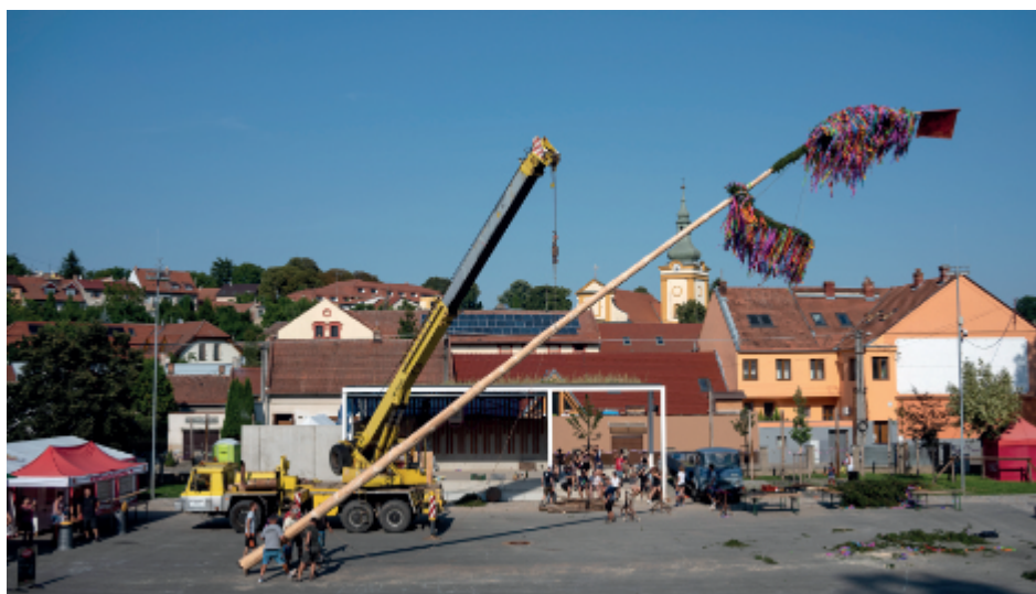
Stavění máje v pátek 13. srpna 2021.