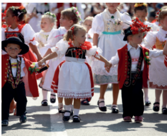
Folklorní odpoledne s Dambořankou v neděli 15. srpna 2021.