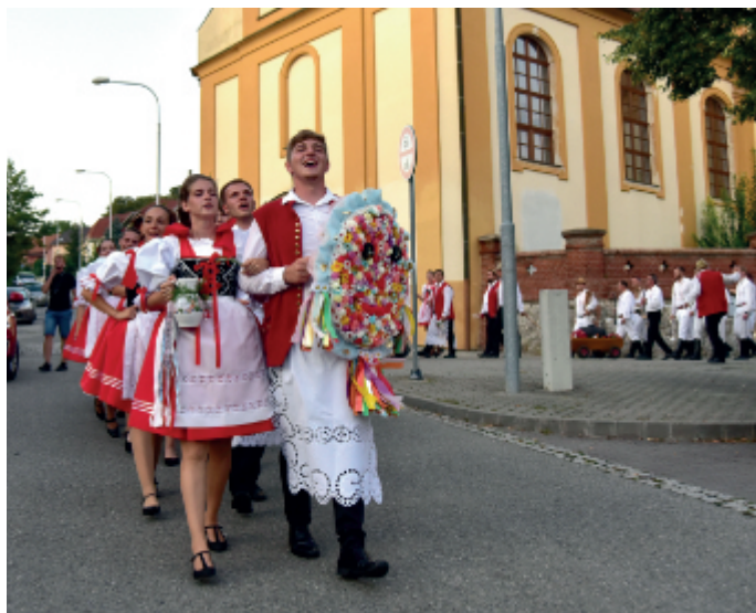
Krojovaný průvod k předání práva v sobotu 14. srpna 2021.