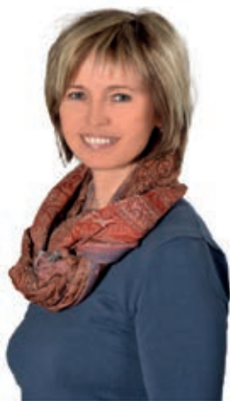
Michaela Trněná starostka

ráda bych touto cestou poslala Vám všem několik slov. Zažíváme neobvyklou situaci, nouzový stav vyvolaný epidemií koronaviru, který se nás všech hluboce dotýká. Nacházíme se ve stavu ohrožení a nejistoty. Nesmírně si proto vážím semknutí, solidarity, odhodlání a bojovnosti, které v těchto dnech ve Šlapanicích a Bedřichovicích vidím.