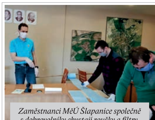
Zaměstnanci MěÚ Šlapanice společně s dobrovolníky chystají roušky a filtry pro seniory a potřebné