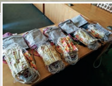
Velké poděkování patří všem, kteří se podílejí na výrobě i distribuci roušek